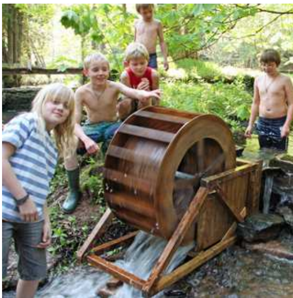
Mühlenpädagogik pur mit Überraschungen...

Unser Nachbau nutzt einen kleinen Höhenunterschied der Moosalb im Bereich des alten Schöllbronner Schwimmbads, um in etwa die Kraft eines Mofa-Motors zu erzeugen.